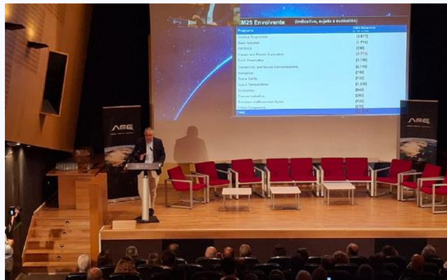
Participació en la jornada "Hacia la Conferencia Ministerial de la ESA 2025" (08/07/2025)