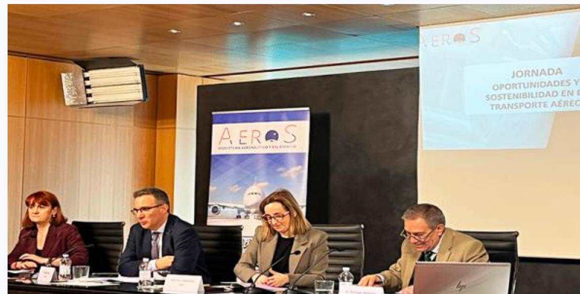
Jornada AeroS: Oportunitats i sostenibilitat en el transport aeri (19/03/2025)