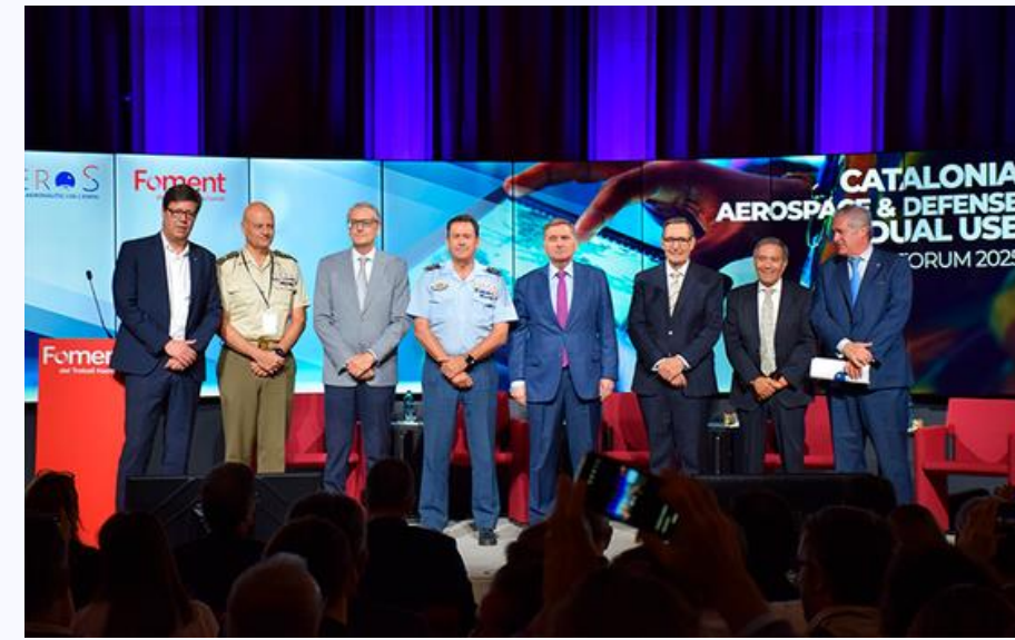
Catalonia Aerospace & Defence Dual-Use Forum 2025 (08/07/2025)