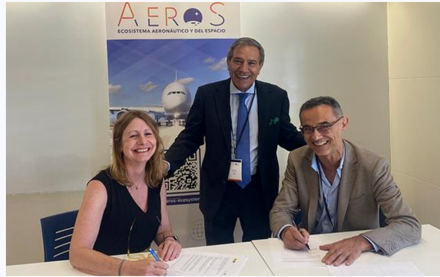
Acord estratègic AeroS – Airport Regions Council (10/07/2025)