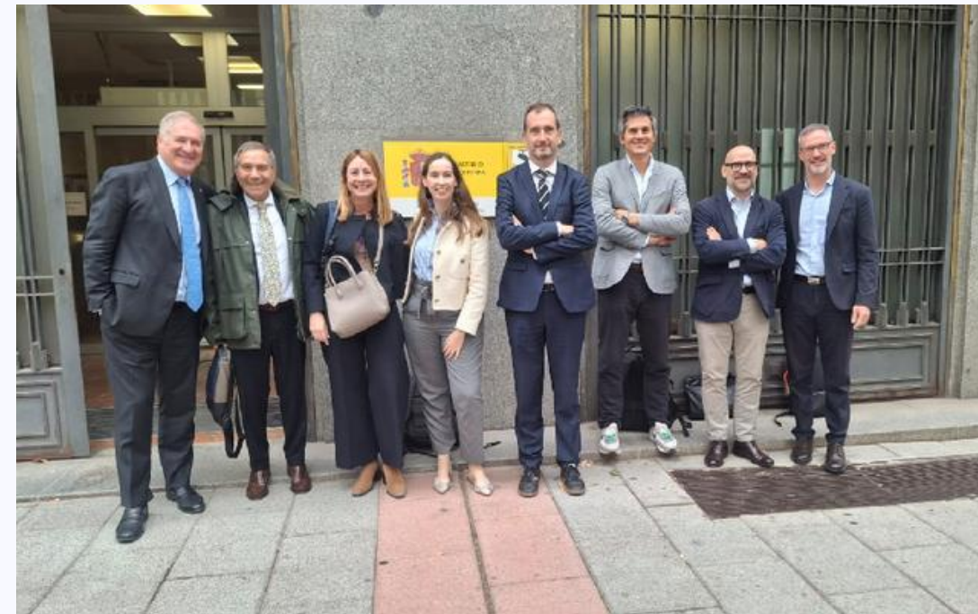
Reunió amb DIGEID – Direcció General d'Estratègia i Innovació de la Indústria de Defensa (13/10/2025)