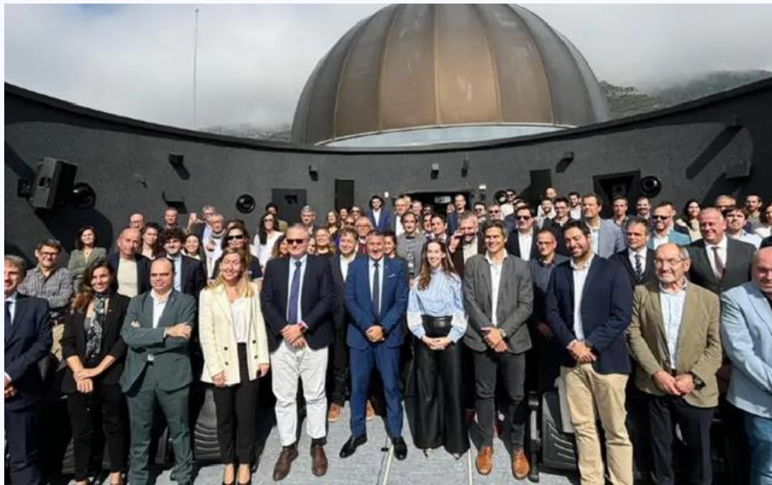
Participació en la presentació de Catalunya Espai 2030 (10/10/2025)