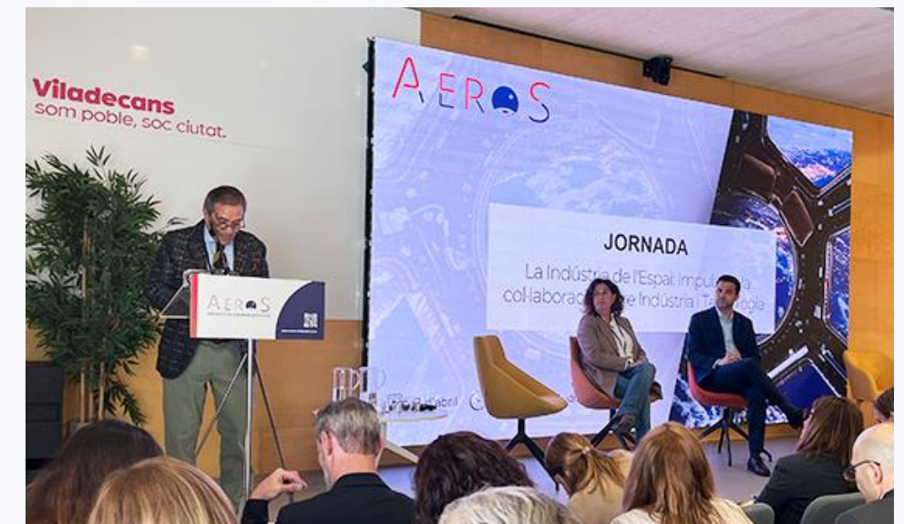
Jornada AeroS – La indústria de l'espai: col·laboració indústria-tecnologia (08/04/2025)