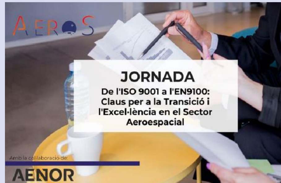
Workshop AeroS & AENOR – certificació EN9100 (09/10/2025)