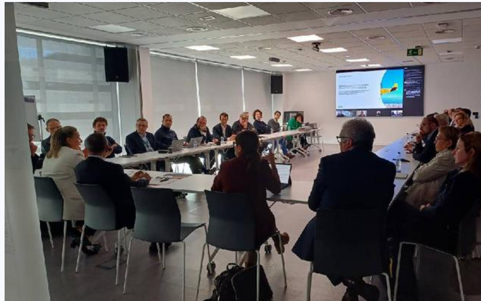
Reunió Comissió de Projectes AeroS – Vueling (16/01/2025)