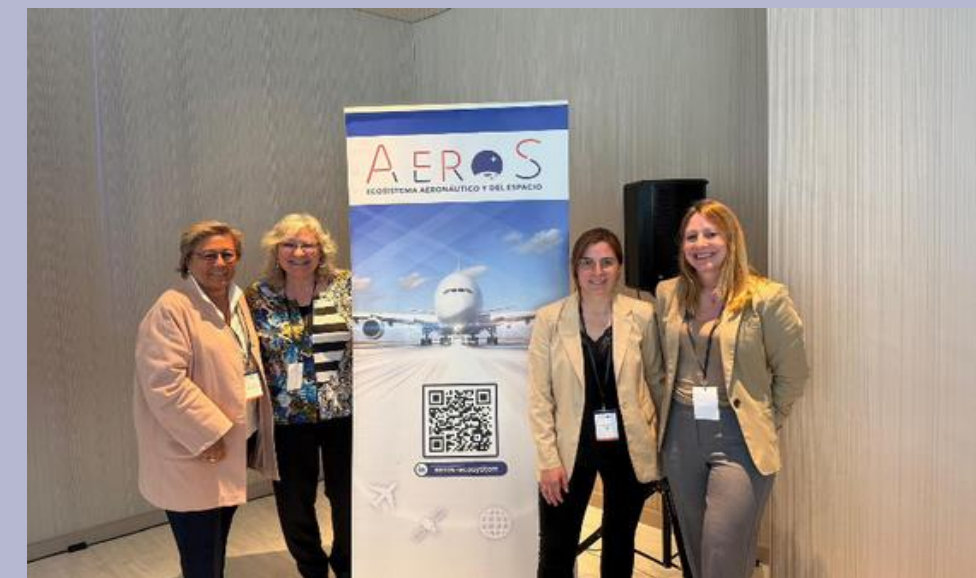
AeroS y la FAGEM firman acord estratègic (19/05/2025)