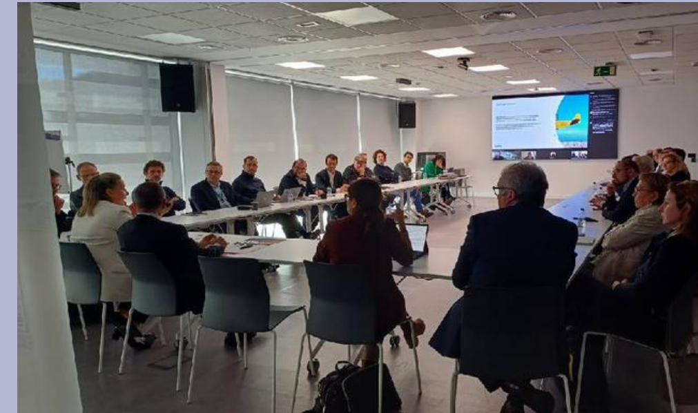
Consell Assessor i Junta Directiva d'AeroS (26/02/2025)