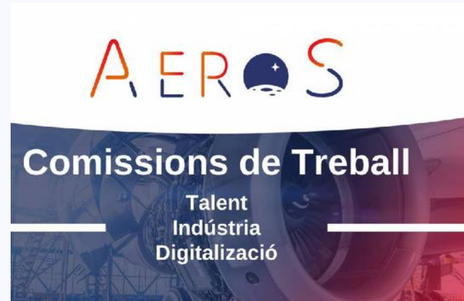
Llançament de les Comissions de Treball d'AeroS (11/02/2025)