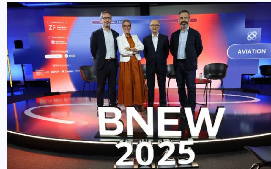
Barcelona New Economy Week (BNEW) (29/09/2025)