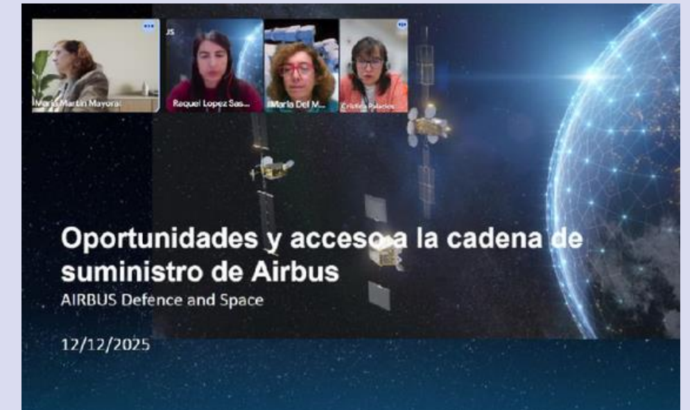
Workshop AeroS & Airbus – accés a la cadena de subministrament (12/12/2025)