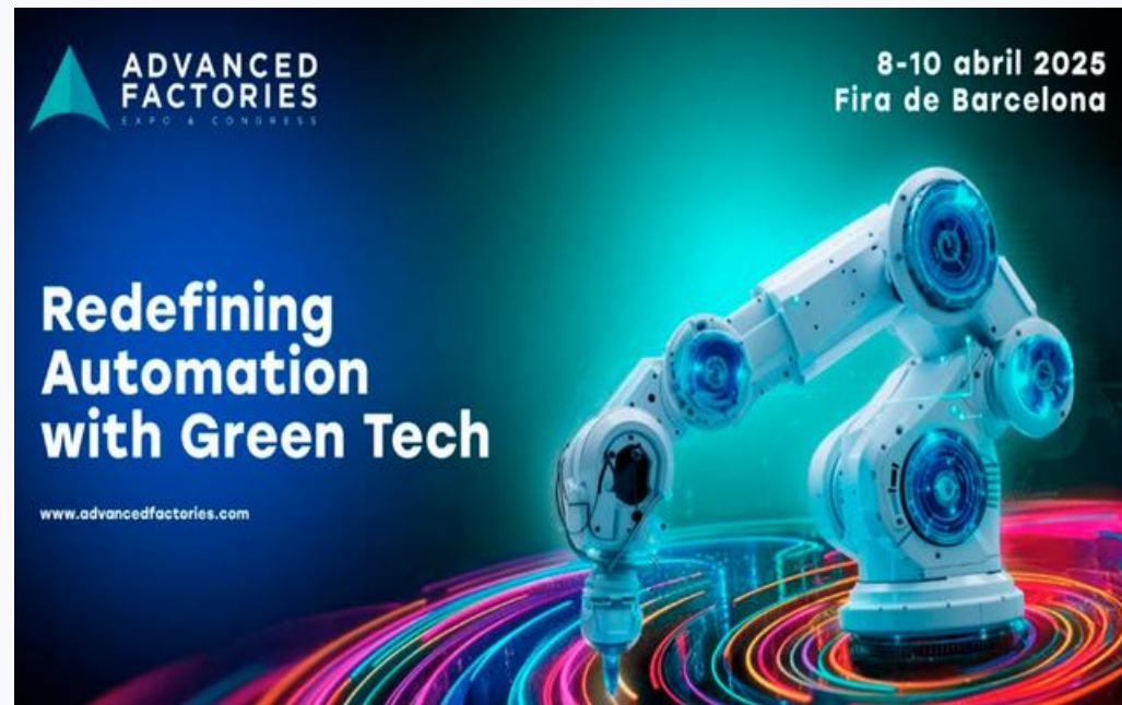
Participació en el Advanced Factories (08/04/2025)