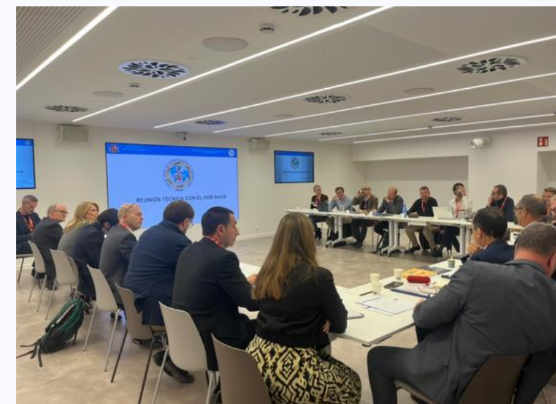
Sessions presencials Taskforce (varies dates)