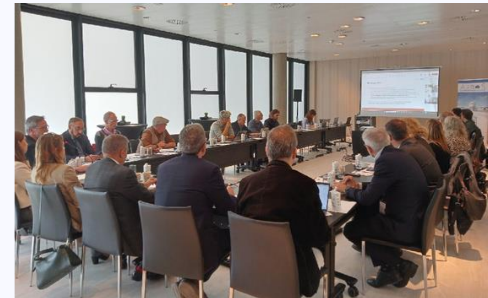
Sessió Comissió de Projectes (08/05/2025)