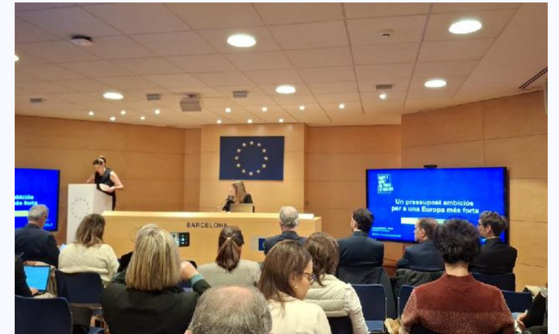
Presencia en la presentació del Marc Financer Plurianual de la UE 2028-2034 (11/12/2025)