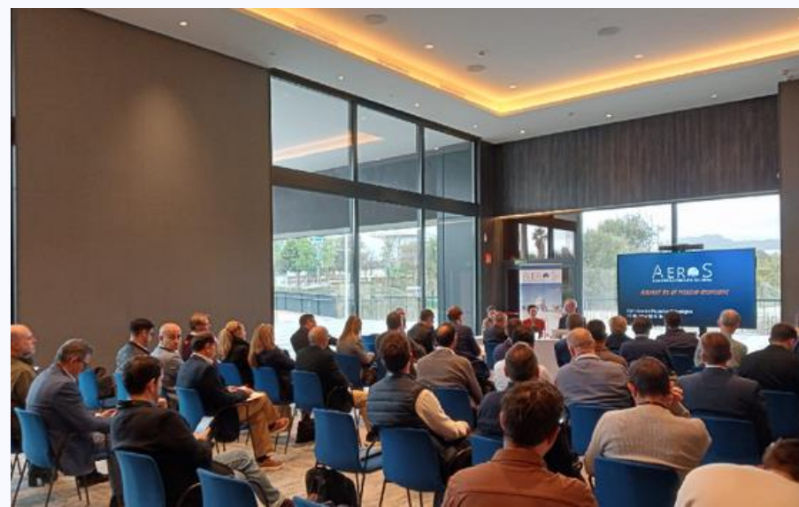
Sessió Comissió de Projectes (21/11/5/2025)